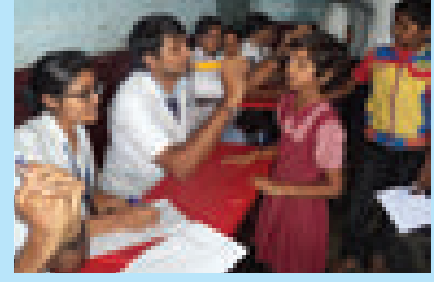
பள்ளி சுகாதார திட்டம்